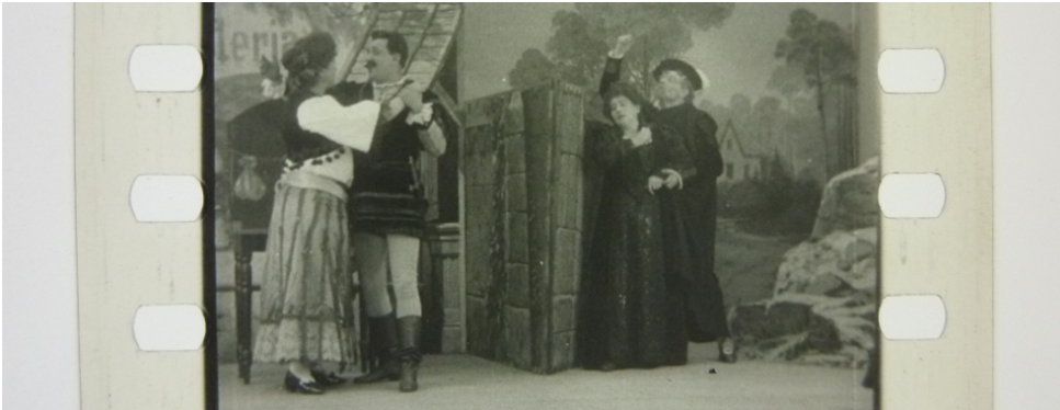
Bild links: Tonbild zu RIGOLETTO: Quartett No. 77 (Deutsche Bioscop, DE 1909)

Unterstützt durch die Beauftragte der Bundesregierung für Kultur und Medien