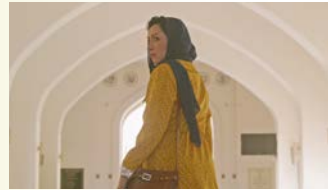
MARYAM PAGI KE MALAM MARYAM → 9