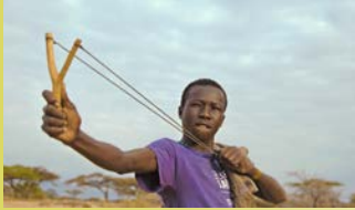
BETWEEN THE RAINS → 6