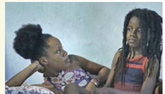
CAMINO DE LAVA / IFÉ / UNDER THE RAINBOW → 12/13