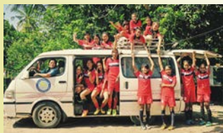
LOTUS SPORTS CLUB → 14/15