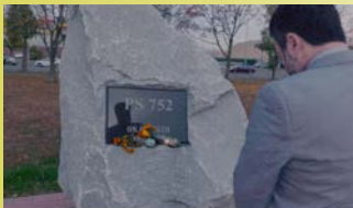
752 IS NOT A NUMBER → 10