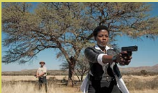
UNDER THE HANGING TREE → 11