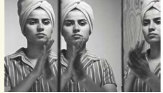
FREMONT → 7