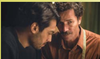
LE BLEU DU CAFTAN DAS BLAU DES KAFTAN → 14