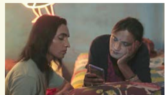
A PLACE OF OUR OWN → 15

Begleitprogramm Accompanying program → 16 ff.