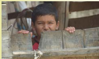
PILEH O PARVANEH KOKON UND SCHMETTERLING → 10