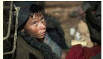
TOPOS MOLES → 11