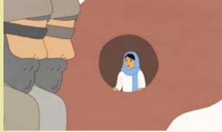
INSIDE KABUL → 6/7