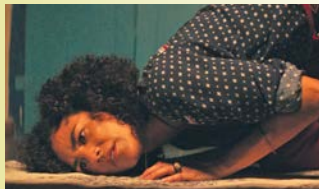
FOGAREU → 12